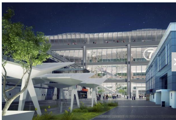
Hall 7 Parc des expo - Versailles © Valode & Pistre

Pavillon 7 du parc des expositions de Paris un projet repensé et aéré