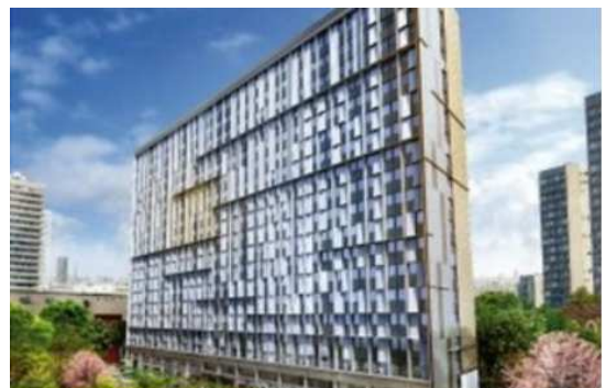
En tout, plus de 500 logements neufs vont se créer à la place des 18 000 m 2 de bureaux obsolètes.